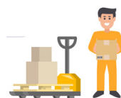
13. Carga (por palets o caja a caja)